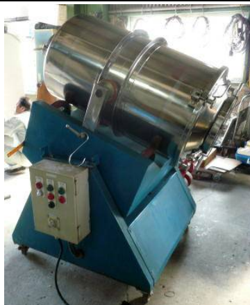
ロッキング・ミキサー機・オーバーホール前・改修後